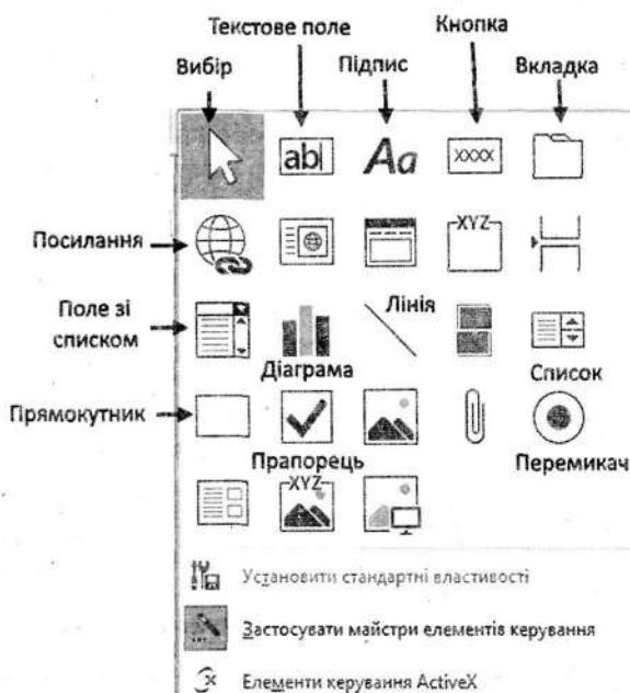
Рис. 1. Елементи керування форм

На рисунку вказано назви деяких елементів керування. Для отримання назв інших елементів достатньо встановити на них курсор. Опис найчастіше вживаних елементів керування наведено в табл. 1.